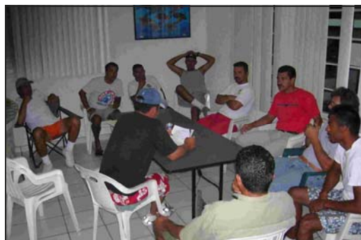
La participación, clave para alcanzar acuerdos y aprovechar los beneficios.

Otra situación que va a facilitar la integración y funcionamiento del Consejo Asesor, es que de alguna forma muchos de los que tienen que estar representados ya están participando en el consejo de la reserva de las Islas del Golfo. Este consejo también ha estado viendo asuntos relacionados al Parque Nacional del Archipiélago de San Lorenzo, y deberá ahora ampliar sus funciones a la reserva de Bahía.