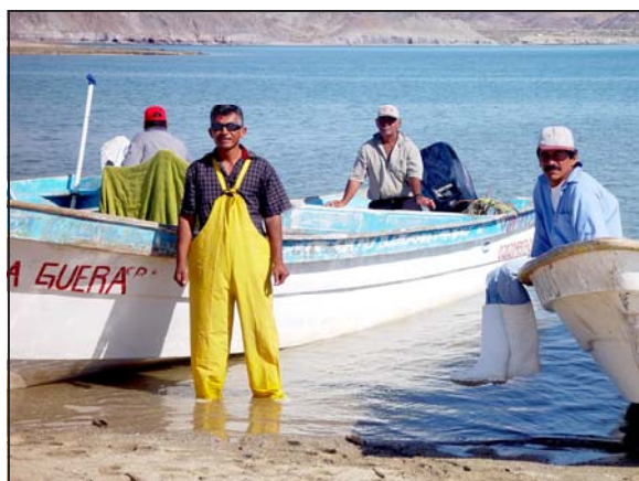
La pesca, asegurada en la nueva reserva.

✓ En el programa de manejo los pescadores podrán proponer medidas para mejorar la pesca, como por ejemplo artes de pesca permitidos y no permitidos, si hace falta alguna temporada de veda (para permitir la reproducción de alguna especie), o si conviene dejar descansar algunas áreas de pesca en forma temporal.